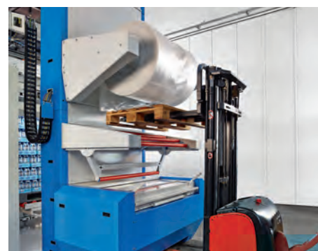
Die Folienrolle kann mit wenigen Handgriffen und ohne Werkzeug gewechselt werden.

Wie bringen Sie palettierte Waren besser und vor allem noch wirtschaftlicher unter die Haube? Ganz einfach: mit dem besonders effizienten und kompakten BEUMER stretch hood® A. Er zeichnet sich durch seine hohe Systemleistung, die ergonomische Bedienung und platzsparende Bauform aus. Damit liefert die BEUMER Group zusätzliche Möglichkeiten hinsichtlich wachsender Anforderungen an die Maschinensicherheit und Wirtschaftlichkeit in der Verpackungsindustrie.