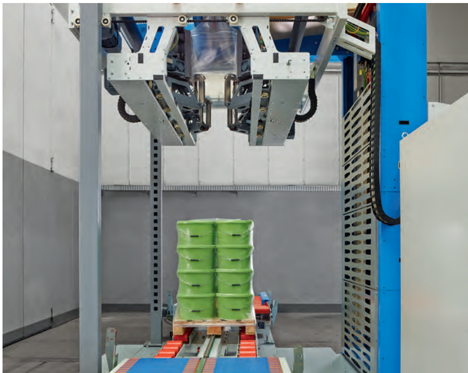
Unterschiedliche Arten von Packgütern werden durch die wasserdichte Folienhaube geschützt.